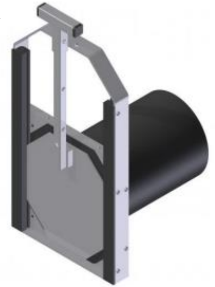
Duikerafsluiter KWT Waterbeheersing

Kijk voor meer voorbeelden op: https://www.kwtwaterbeheersing.nl/